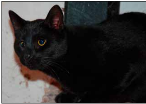
Finaste Tappie är en blind hankatt, intagen från Tomelilla.

På Kattkommando Syds hemsida, kks.nu, hittar du många av katterna på bild under Malmö katthem eller Katter som söker försäkringsfadder.