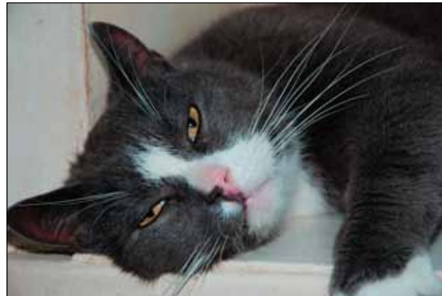
Keliga Jonas har haft besvär med tänderna och urinstenar.