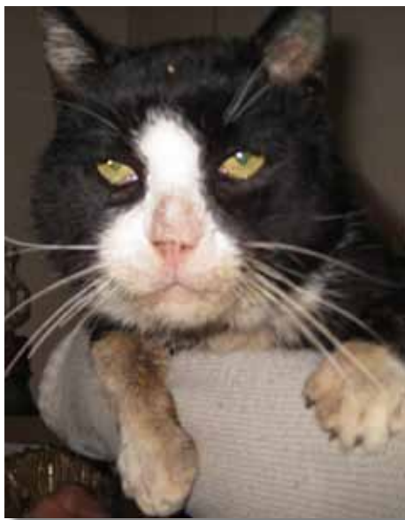
Elviskatten fick fångas med fälla, han hade dålig erfarenhet av människor. Väl intagen visade han sig vara social och kelen! Det är dags att folk slutar säga "En katt klarar sig alltid!" och tar sitt ansvar!

Till vår stora sorg var det tyvärr försent att rädda hans liv. Han hade varit bortvald för länge... Så otroligt kelen och tacksam han var för den lilla omsorg kvinnan och vi andra hann att ge honom. Vi önskar bara att vi funnit honom långt tidigare.