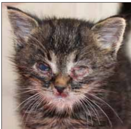
Lillen hade inte klarat sig länge till på egen hand när han sjuk och svag togs in av KKS. Efter en månads behandling är han numera en pigg och nyfiken kattunge som söker ett eget hem med kattkompis att leka med.

Lillen fick genast behandling med två olika sorters ögonsalva och antibiotika. Han vätskades upp med kattmjölkserättning och ögonen tvättades med koksaltlösning flera gånger om dagen. Lillen undersöktes också av veterinär.