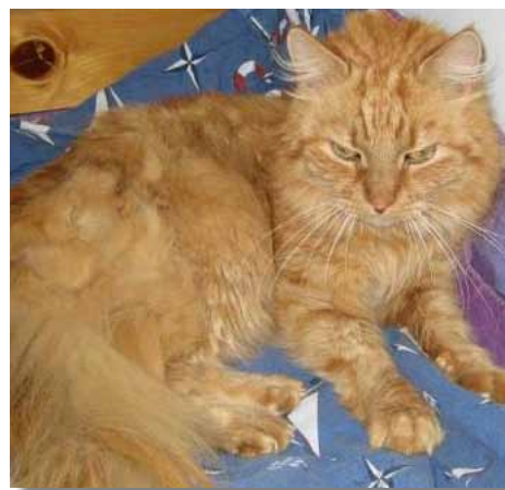
Sudden myser i sängen, lycklig över att vara hemma igen med säker tillgång till den fyllda matskålen!

Gör ditt yttersta för att hitta en katt som försvunnit av misstag! Sätt genast ut mat, gå runt och leta, sätt upp lappar, ring polisen och anmäl försvinnandet, och annonsera.