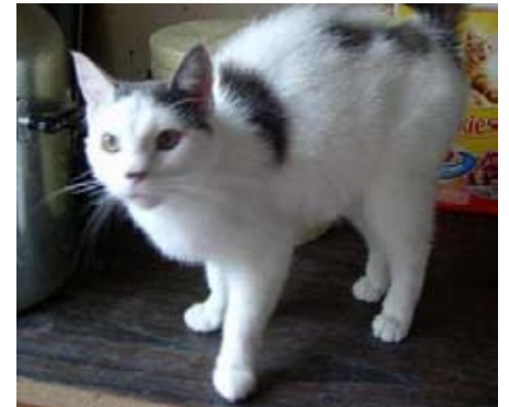
Mamma Ottar mår bra nu och har fått eget hem.

En del katter har turen att bo i stödhem på landet där de får komma utomhus. Men trafiken är alltid en risk. Missie blev påkörd, men klarade sig. Hon togs till Smådjursakuten på Gullbringa Säteri utanför Kungälv. Första fakturan gick på 989 kr, återbesöket 3 334 kr då hon opererades. Skönt att det gick bra för Missie!