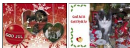
Motiv 3 & 4

Om du samtidigt vill beställa julkort för att spara porto, går det bra. Julkortet levereras samtidigt. OBS! Du får en almanacka+20 julkort för samma porto, dvs 1 almanacka och 20 julkort kostar 205:- (120:- + 85:-).