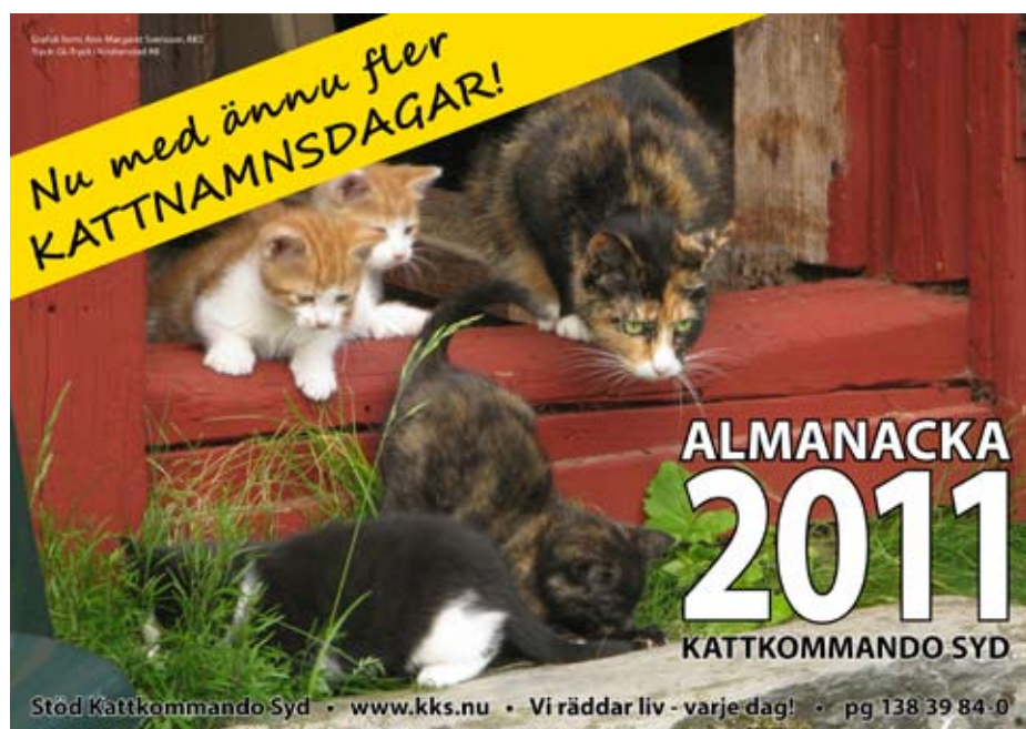
Almanackan poserar en liten del av alla de nödställda katter som Kattkommando Syd hjälper till ett bättre liv.

Redaktör Birgitta Carlsson, birgitta@kks.nu | Grafisk form Ann-Margaret Svensson, ann-margaret@kks.nu | Tryck KP-tryck i Karlskrona