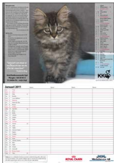
Ett månadsuppslag med kattbild och gott om plats för notering av aktiviteter i fyra kolumner.