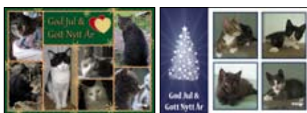
Motiv 1 & 2

Almanackan finns även att köpa på olika försäljningsställen i Karlskrona, Karlshamn, Sölvesborg, Bromölla, Kristianstad, Hässleholm, Malmö med flera orter. Se mer information på vår hemsida, www.kks.nu , eller ring 070-412 90 68. Det finns plats för fler kattnamn. Maila ditt förslag senast den 31 juli 2011 till webmaster@kks.nu .