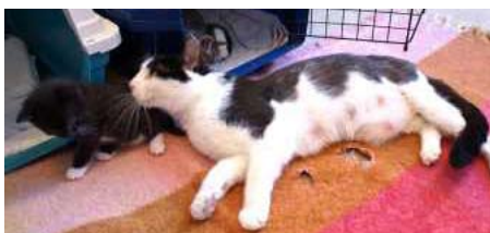
Majsan med sonen Sotis myser tillsammans.

Här följer en inblick i hur det kan se ut under en vecka: