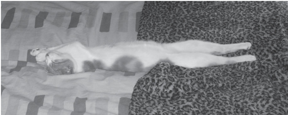
Totalt avslappnad sträcker Valle ut sig i hela sin kattungelängd på husse och mattes säng.