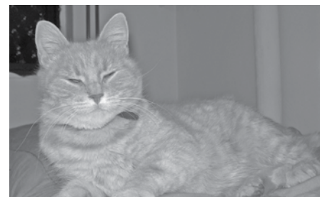
Misen bor i stödhem i Kivik. Stödhemmet ska flytta och Misen behöver ett nytt hem.

TACK! Swebase som sponsrar med extra serverutrymme, e-postadresser och e-postlistor till vår hemsida, www.kks.nu . www.swebase.se