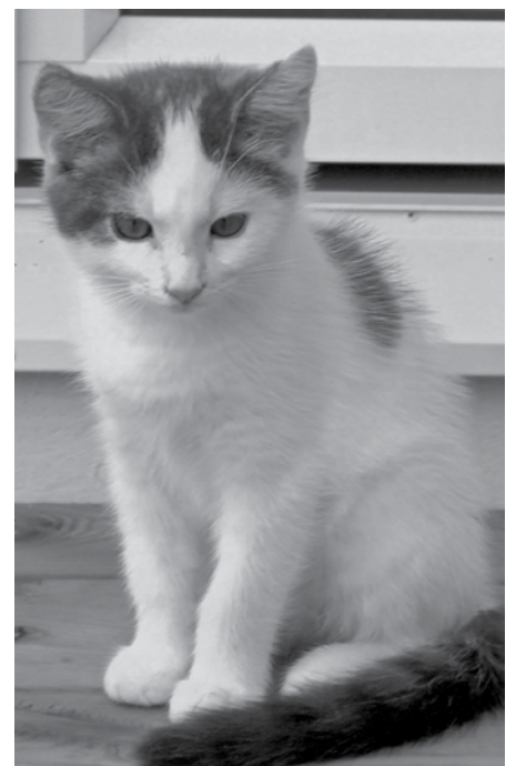
En hemlös kattunge sedan husse mördats.

Marie-Louise Blomberg 0455-413 23, 070-521 13 23 Ingrid Kjellgren 0144-320 40, 070-730 34 56